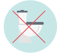
Jarang Buang Air Kecil